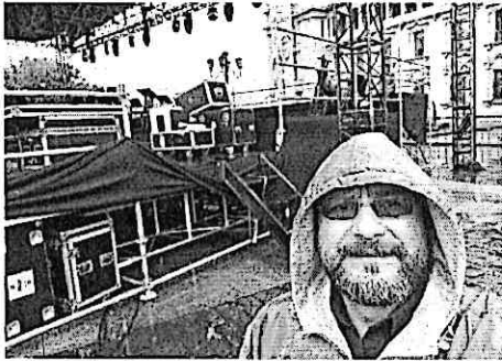
Apoyo Logístico Concierto Orquesta Sinfónica y Banda Marcial