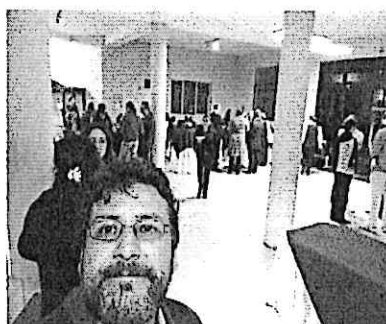
Presentación Cuarteto Primavera Conservatorio Nacional de Música