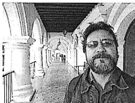
Presentación Cuarteto primavera MUNAG