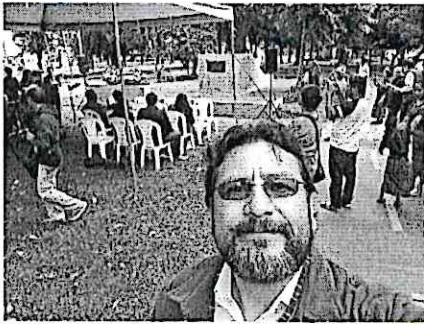
Apoyo Logístico Ofrenda Floral Miguel Angel Asturias