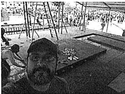
Apoyo Logístico Presentación Ballet Guatemala, festival del Centro Histórico