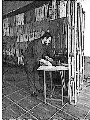
Amplificación de sonido Presentación Cuarteto Primavera Zacapa