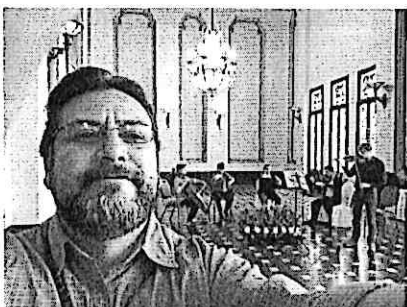
Ensayo Abierto Palacio Nacional de la Cultura