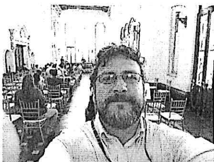
Participación presentación artística tardes de Arte