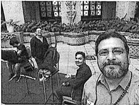
Ensayo Abierto Cuarteto Primavera Palacio Nacional de la Cultura